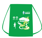
Gift Bag 禮物袋