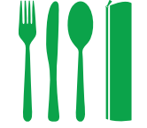
Environmental Cutlery Set 環保餐具